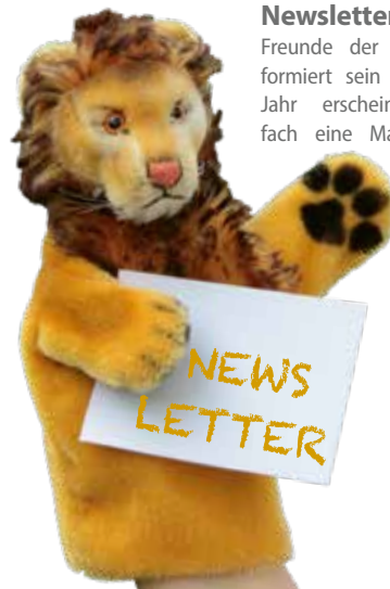
Grafik-Design & Konzeption: © www.maduck.de

Newsletter gefällig? Ein Angebot für alle Freunde der PuppenParade Ortenau, die immer informiert sein möchten, ist der zwei bis drei Mal im Jahr erscheinende Newsletter. Schicken Sie einfach eine Mail mit dem Stichwort „Newsletter“ an presse@puppenparade.de , und Sie sind immer auf dem Laufenden. Ihre Adresse wird nicht weitergegeben. Der Newsletter wird jederzeit wieder abbestellt werden.