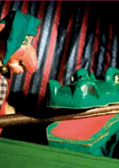
Kasper fängt das Krokodil Puppentheater Gugelhupf, Gernsbach