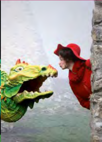
Onil, der Drache Oniversum, Freiburg

Die Drachenhüterin spaziert mit Onil durch die Straßen der Stadt, stets auf der Suche nach Futter und Mutigen, die den Zweibeiner füttern, denn was andere nicht mehr schätzen, das ist Onils Schatz und Lebenselixier: alte Fahrkarten, Bonbonpapiere, Kassenzettel... Müll... kostbare und wertvolle Nahrung für das ungetüme Verwandlungsgenie. Alles, was die ausgeprägte Drachennase erschnüffelt, landet im magischen Magen, der akustisch auffällig verdaut, verwandelt und recycelt. Im Sättigungsfall kann es sogar passieren, dass Onil ein magisches Drachenei ausbrütet.