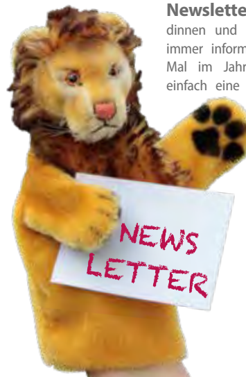
Grafik-Design & Konzeption: © www.madhuclights.com

Newsletter gefällig? Ein Angebot für alle Freundinnen und Freunde der PuppenParade Ortenau, die immer informiert sein möchten, ist der zwei bis drei Mal im Jahr erscheinende Newsletter. Schicken Sie einfach eine Mail mit dem Stichwort „Newsletter“ an presse@puppenparade.de , und Sie sind immer auf dem Laufenden. Ihre Adresse wird nicht weitergegeben. Der Newsletter kann jederzeit wieder abbestellt werden.