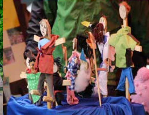
Dayoub & Naga Producciones Abismales, Berlin